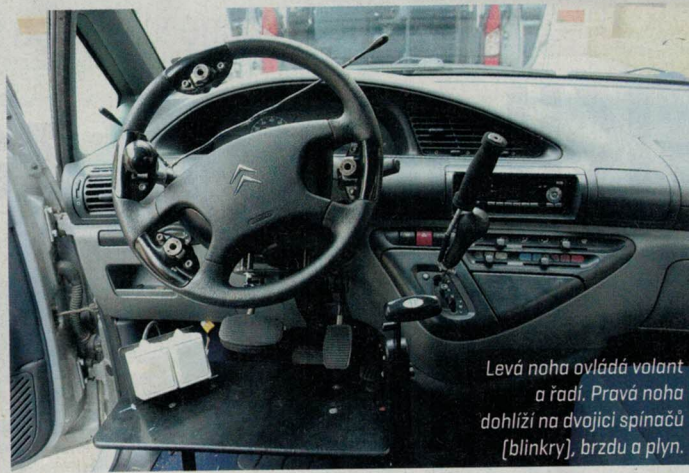
Levá noha ovládá volant a řadu. Pravá noha dohlíží na dvojici spínačů (blinkry), brzdu a plyn.