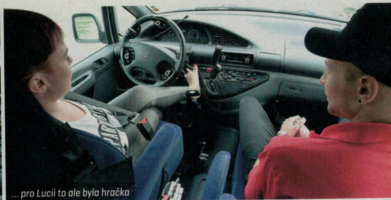
... pro Lucii to ale byla hračka