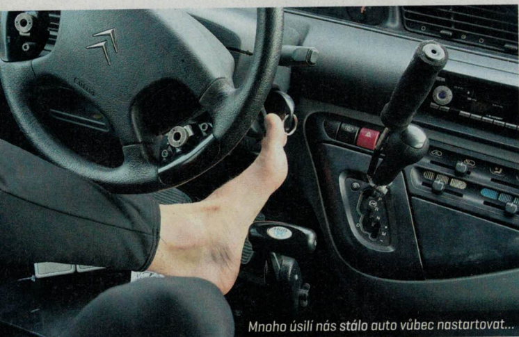
Mnoho úsilí nás stálo auto vůbec nastartovat...