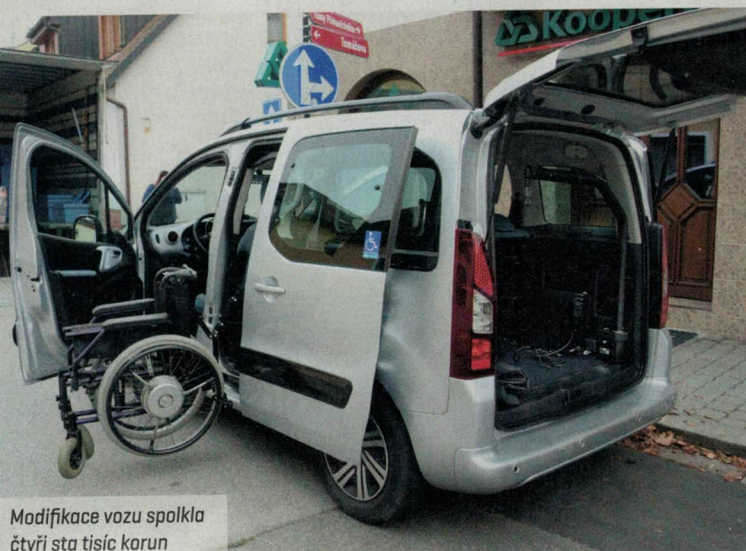
Modifikace vozu spolka čtyři sta tisíc korun