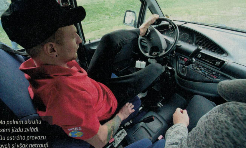
Na polním okruhu jsem jízdu zvládl. Do ostrého provozu bych si však netroufl.