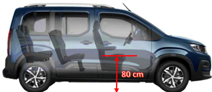
Příklad Peugeot Rifter